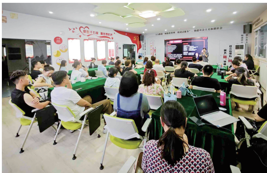
“惠工夜校”培训班吸引众多学员前来听课。

如何去除一身“班味儿”?下班以后除了躺在床上玩手机还能干点啥?当代年轻人倾向于用新鲜、专注、不设限的活动对抗“精神疲惫”和生活压力,而岛城青年们青睐的“下班新生活”,正以夜校为载体火热兴起。在“8小时”之外的时间里,他们拼命吸纳着不同领域的知识,掌握了“N”技之长,甚至破除失业焦虑找到新工作。夜校正以一种正能量的方式,改变着年轻人的生活。近日,记者走进市南区的夜校,在组织者、教师和学员中,探寻夜校持续火热的原因。