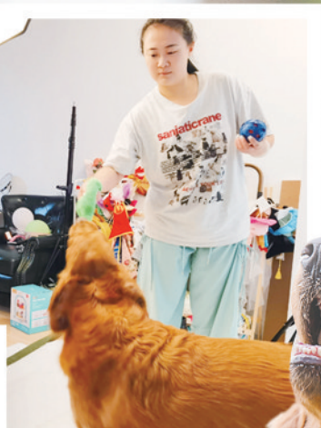
▶ 宠物摄影师王一然拍摄的宠物照片。