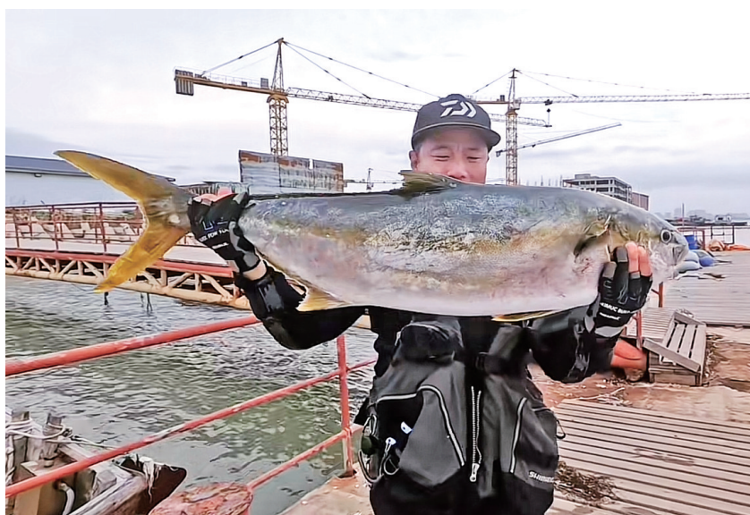
钓友“清凉草”展示钓获的“黄鲢牛”。 视频截图

“清凉草”在发布的视频中总结说,“黄鲢牛”一般会在5月到黄海海域产卵,7月初开始开口比较好钓,一直能钓到11月初,喜欢搏鱼的钓友可以有目标地试钓。但“黄鲢牛”警惕性高,海水清澈时中鱼会少,如果遇上阴