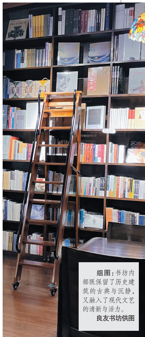
组图:书坊内部既保留了历史建筑的古典与沉静,又融入了现代艺术的清新与活力。

良友书坊所在的建筑本身就具有浓厚的历史底蕴。它不仅是青岛最早一批复合型咖啡店的代表,更是一座承载着百年历史的德国哥特式建筑。1901年建成的塔楼位于四楼,历经沧桑,依旧保持着其独特的韵味和魅力。穿过挂满旧海报的红木楼梯,仿佛穿越了时空,回到了那个充满故事的年代。而书坊内部,历史与现代的元素巧妙结合,既保留了历史建筑的古典与沉静,又融入了现代艺术的清新与活力。