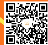
扫码观看相关视频