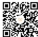
扫码观看心肺复苏正确做法

解开患者衣服,将一只手的掌根紧贴患者胸部正中,两乳连线水平,双手十指相扣,掌根重叠,掌心翘起,双上肢伸直,上半身前倾,以髋关节为轴,用上半身的力量垂直向下按压,确保按压深度5厘米到6厘米,按压频率每分钟100次到120次,保证每次按压后胸廓完全恢复原状。30次按压后,检查口腔有没有异物。用仰头举颏法开放气道,使患者下颌角及耳垂的连线与水平面垂直。在开放气道的同时进行人工呼吸。施救者用嘴罩住患者的嘴,用手捏住患者的鼻翼,吹气两次,每次约1秒。吹气时可将患者胸廓隆起,按压过程中尽量减少胸外按压的中断,每做30次胸外按压,进行两次人工呼吸,此为一组循环,每五组评估患者呼吸和脉搏。AED(自动体外除颤器)一旦取来应尽快使用。打开AED电源开关,按照语音提示操作。根据电极片上的图示,将电极片分别贴在患者胸部的右上方和左乳外侧,等待AED分析心率以确定是否需要电击除颤。得到除颤指示后,示意周围人不要接触患者,等待AED充好电,按下电击按钮除颤。除颤后还要继续以30:2的比例进行胸外按压和人工呼吸。两分钟后AED会再次自动分析心率,AED分析心率时示意周围人不要接触患者,继续遵循AED的语音提示,直到患者恢复心搏和自主呼吸或专业急救人员到达现场。