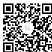
扫码观看 相关视频

青岛地铁按照“一站一线一台”的配置标准,在全线网运营车站、场段,共计配置202台AED急救设备,车站AED摆放位置均满足“黄金4分钟”覆盖要求,为院前急救工作提供较为可靠的保障。同时,持续组织一线人员开展AED设备急救技能培训,确保已投放AED的车站每班至少有两人员接受过专业培训。