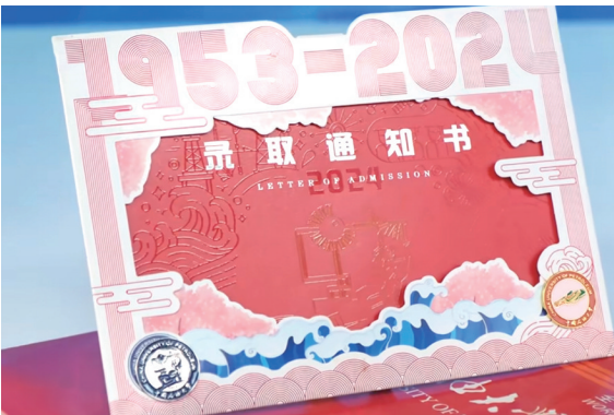
中国石油大学(华东)录取通知书。