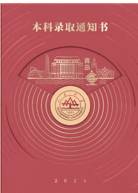
山东大学录取通知书。