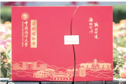
中国海洋大学录取通知书。