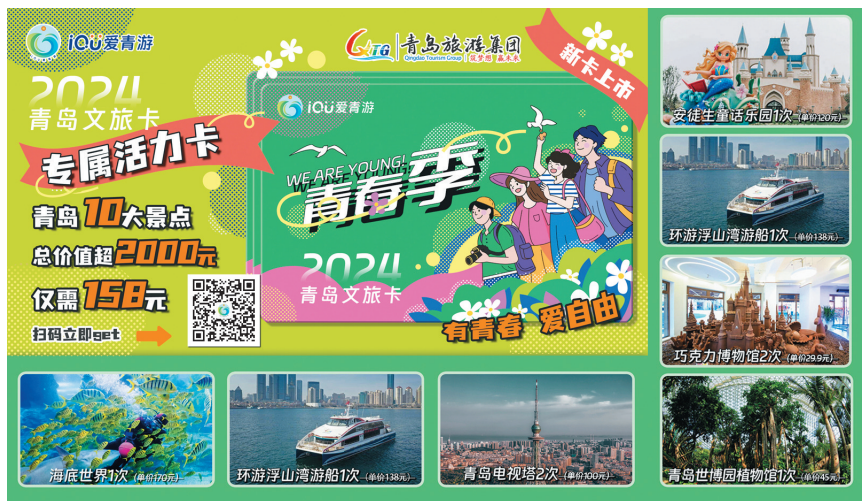
“爱青游·青春季”文旅卡上市。

首先是“好玩”——该卡精选了青岛10个年轻人喜爱的景区，每一处都是与好友、家人一起打卡拍照、分享朋友圈的绝佳地点：从探索神秘的“海底世界”到“青岛电视塔”的高空360°旋转俯瞰城市美景，再到乘坐“环游浮山湾游船”领略帆船中心的壮阔；从沉浸在“安徒生童话乐园”的梦幻中到享受“金麒麟温泉”的放松惬意；从好吃好玩的“巧克力博物馆”穿越到“青岛世博园植物馆”的热带天堂；从“青岛电影博物馆”的光影中漫步到“西海美术馆”“太平角18号艺术中心·首富楼艺术馆”，感受艺术殿堂