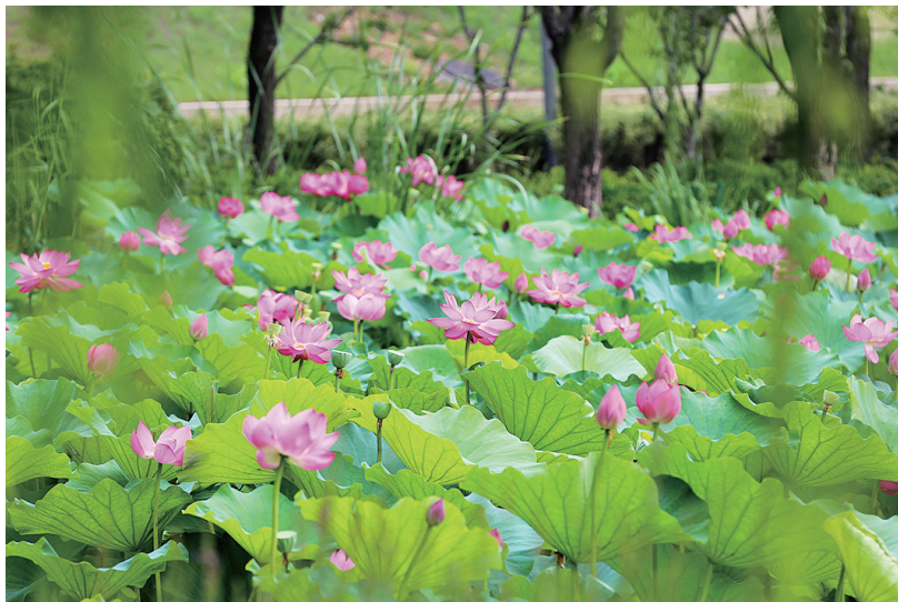
最美荷花季,赏荷正当时。

责编 赵彤 美编 王亮 审读 赵仿严