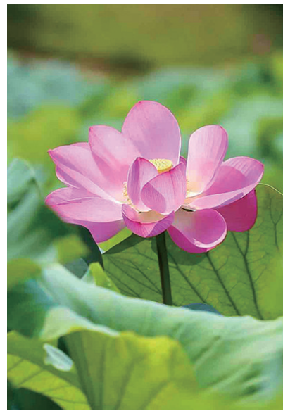
荷花盛开,美轮美奂。

进入盛夏,李村河的荷花盛开。7月10日,在李村河上游靠近常川路桥的位置,河面上有成片的荷花盛开,吸引了不少市民和摄影爱好者在此拍摄。记者看到,河中的荷花千姿百态、亭亭玉立,在绿叶的衬托下,美轮美奂。粉嫩的荷花与青翠的荷叶相映成趣,构成了一幅动人的画卷。微风吹过,荷花的香气扑鼻,令人心旷神怡。夏天,正是荷花盛开的季节,李村河的荷花为岛城的盛夏增添了一抹亮丽的色彩。