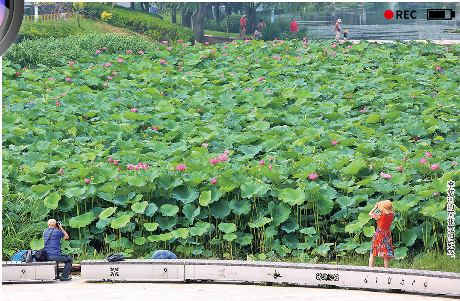
李村河的荷花竞相绽放。