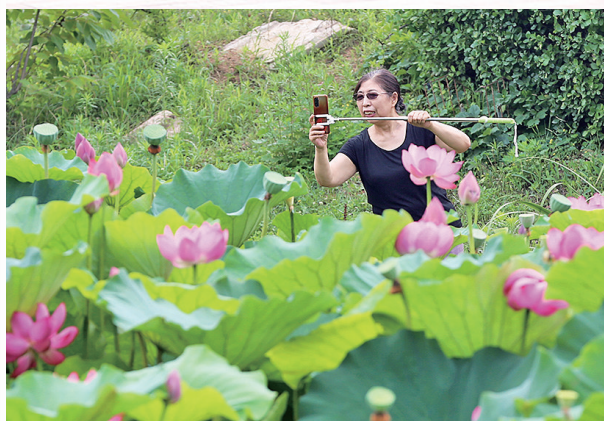
夏日拍荷,捕捉不一样的精彩。