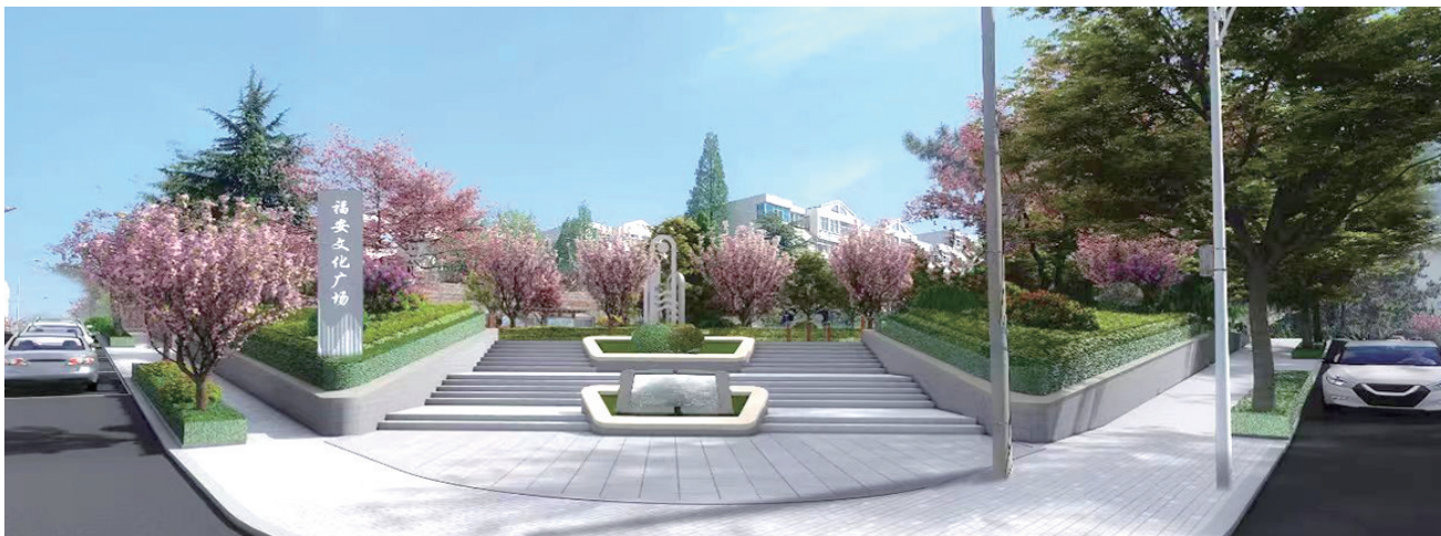
福安文化广场效果图

在市北区充满活力的土地上,随着城市更新战略步伐的稳健迈进,一幅宜居宜业的现代化新城区画卷正徐徐展开。今年,市北区以城市更新“三大场景”为核心驱动力,全面加速城市功能的优化升级、低效土地的盘活利用以及历史城区的活化复兴,每一步都踏出了坚实有力的步伐。