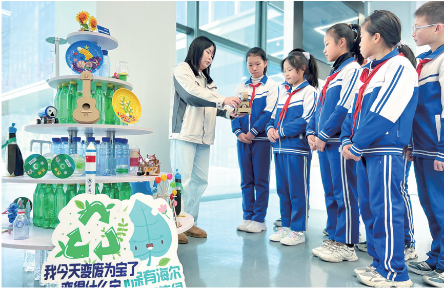
“无废城市”建设宣传进入校园。

在工业领域,国家级绿色工厂总数达到54家,青岛入选国家废旧物资循环利用体系建设重点城市,全面提升循环化利用水平。发布年度危险废物利用处置设施投资引导性公告,优化危险废物利用处置设施布局。在农业领域,大力