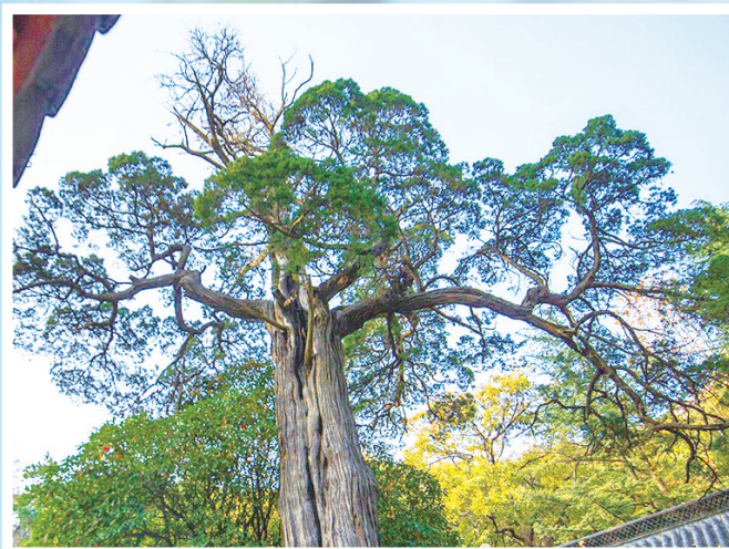
崂山太清宫的“汉柏凌霄”。