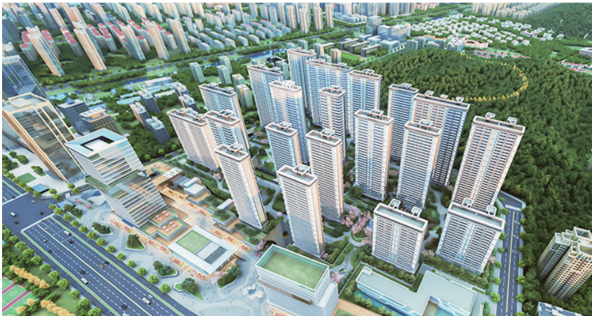
入选青岛市首批高品质住宅试点项目名单的瑞源·名嘉荷府。

早报6月19日讯 近日,2024青岛西海岸新区城市置业活动举办,瑞源控股集团旗下青岛鲁泽置业集团有限公司(以下简称“鲁泽集团”)参加活动并举行专场推介,为推动西海岸新区房产市场的繁荣发展贡献力量。