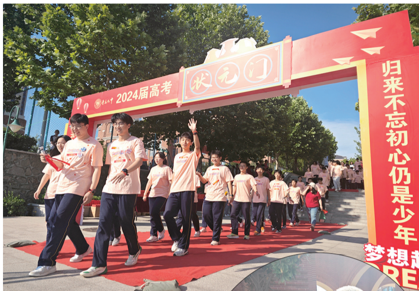
高三考生走过“状元门”。