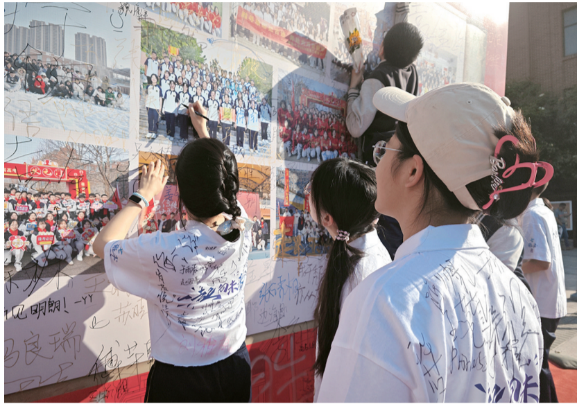
高三学子在心愿墙上写下青春誓言。

早报6月3日讯 为给即将奔赴高考战场的高三学子加油鼓劲,6月3日一大早,青岛九中举行了“金榜高中,院士及第”高考送祝福系列活动。现场,高三学子接过“得胜牌”,走过“状元门”,在礼贤门下留下属于他们的精彩青春。