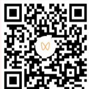
扫码看周甄金采访视频。