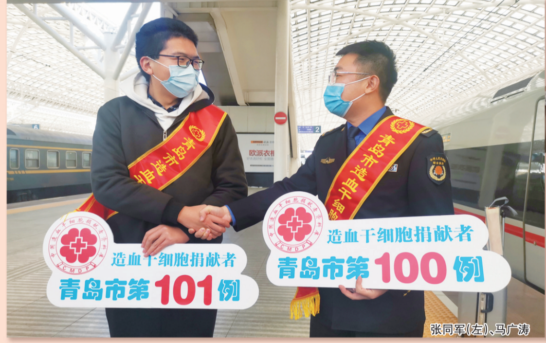
造血干细胞捐献者 青岛市第101例