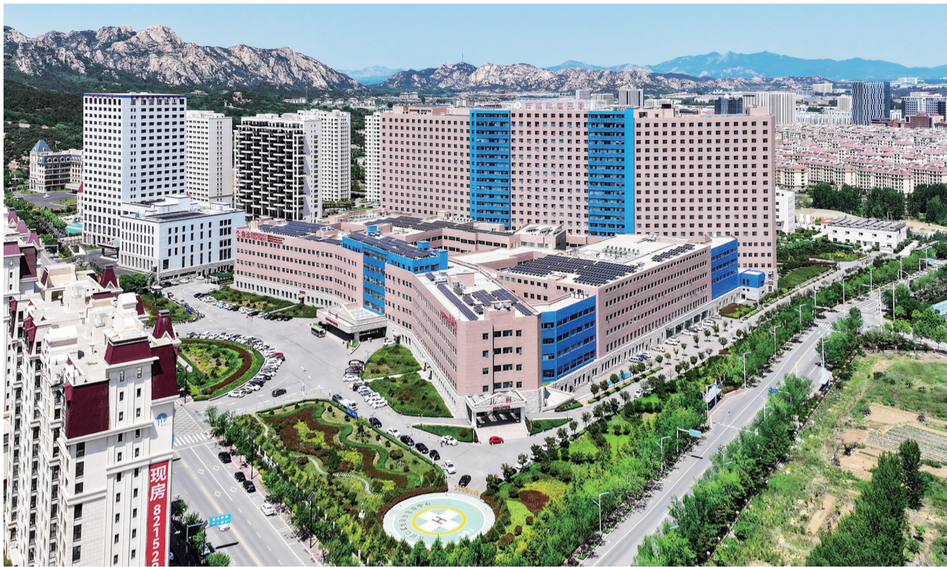
青岛滨海学院附属医院俯瞰图。

坐落在灵山湾畔、大珠山旁,青岛滨海学院附属医院即将迎来开诊四周年的日子。自2020年6月开诊以来,医院不断夯实发展根基,澎湃发展动能,深入推动诊疗精细化、服务高效化,各项综合实力和区域影响力不断提升,持续为广大人民群众的身体健康保驾护航。