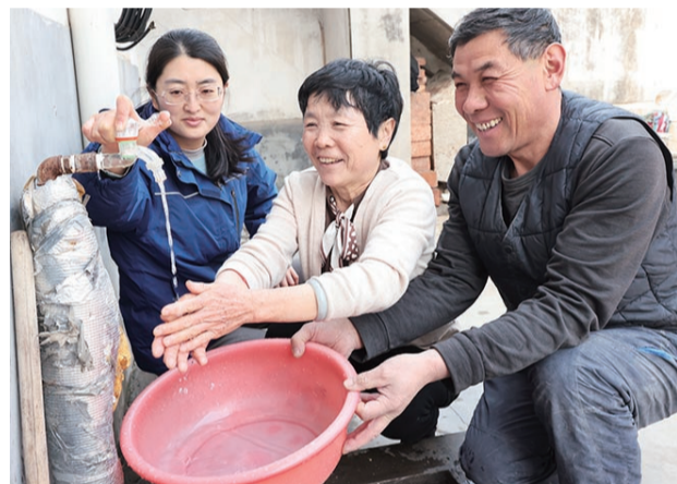
西海岸新区实施城乡供水一体化后,群众喝上了“幸福水”。