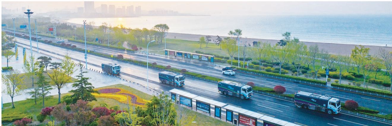
公用集团多机联合作业助力新区道路深度保洁。

青岛西海岸公用事业集团(以下简称“公用集团”)成立于2015年11月,是西海岸新区涉及公用事业领域最多的专业化国有集团公司,主要承担新区供热、供水、排水、市政、园林、环卫、智慧城市和全区一个停车场等市政基础设施建设、运营、服务,以及施工总承包、砂石土资源处置、水环境治理等工作。