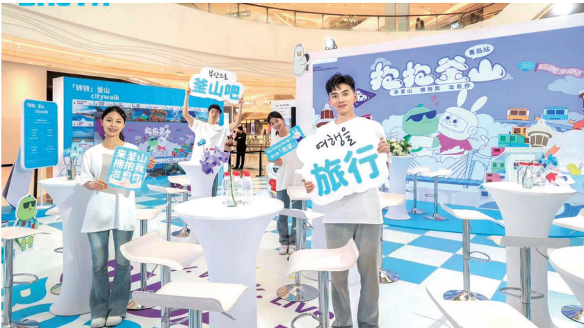
“‘抱抱釜山’青岛站”活动启动。

转釜山 city walk、贴贴釜山、爱的大“抱”光、釜山情“抱”站。在入口处领取“抱抱釜山 passport”,便能沉浸式逛釜山,参加丰富的互动游戏,领取奖品。让游客在“花式拥抱”中,感受釜山、爱上釜山。