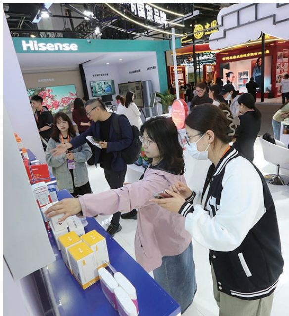
众多观众喜爱青岛品牌产品。