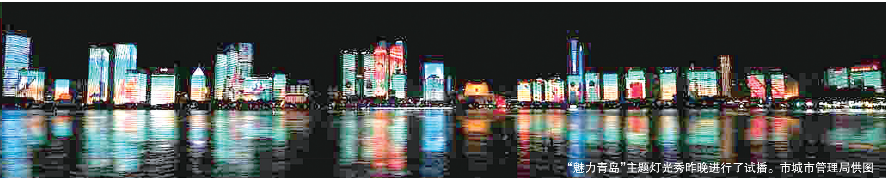
“魅力青岛”主题灯光秀昨晚进行了试播。