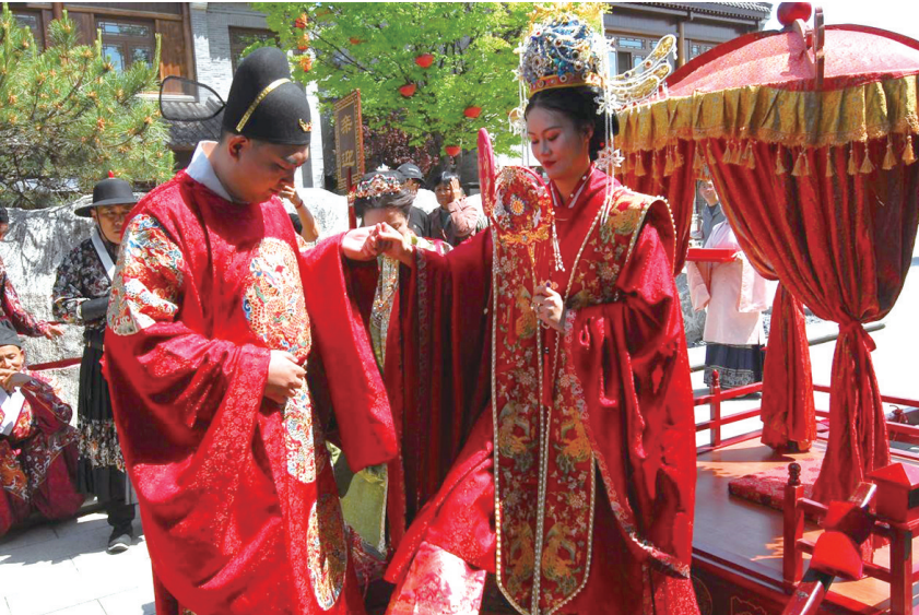
即墨为 6 对新人举办中式集体婚礼。图为新郎送新娘上轿。