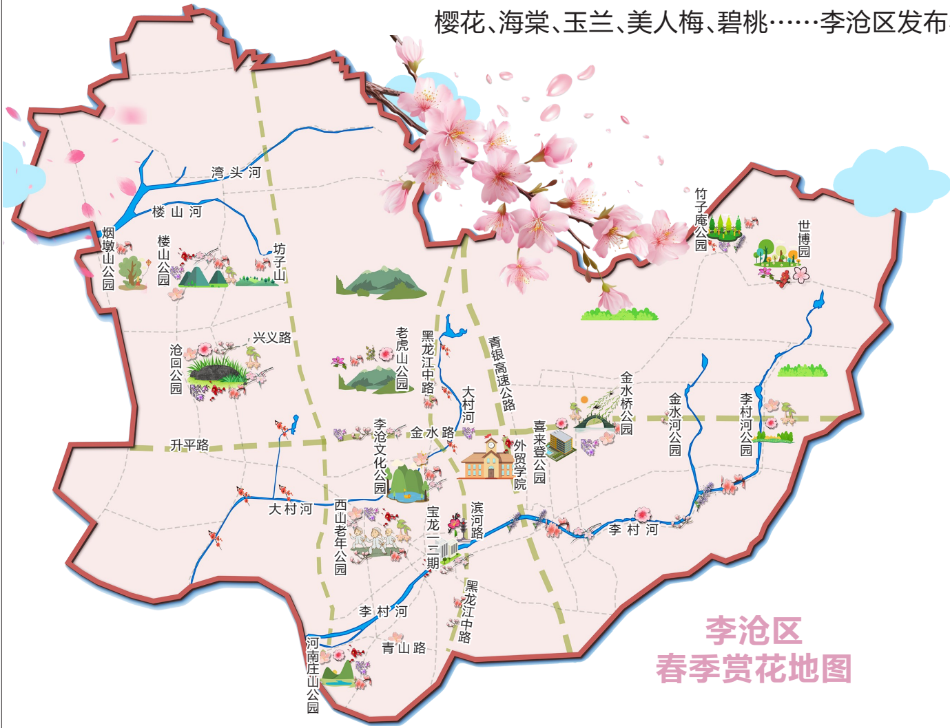
李沧区 春季赏花地图

早报4月10日讯 4月10日,李沧区发布春季赏花地图。樱花作为广大市民朋友喜爱的观赏花,在李沧区也有着广泛种植。沿衡水路北侧,九水路青龙桥向东一直到金水河,有3公里长的樱花大道,现在早樱已经绽放,风一吹,簇拥的花朵轻轻摇曳,如粉色花海一般,晚樱也将很快开满枝头。此处的樱花花期将持续至本月底。