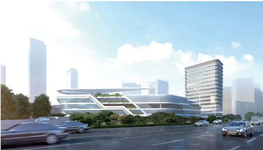
瑞昌路公交停车场项目效果图。

挡、裸土及产尘物料全部覆盖到位、土方湿法作业、场区道路硬化、洒水降尘、出入车辆冲洗干净、渣土车辆封闭运输扬尘防治等措施,为进一歩加快施工进度提供有力保障。