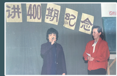
“每周一讲”举办第400期讲座。