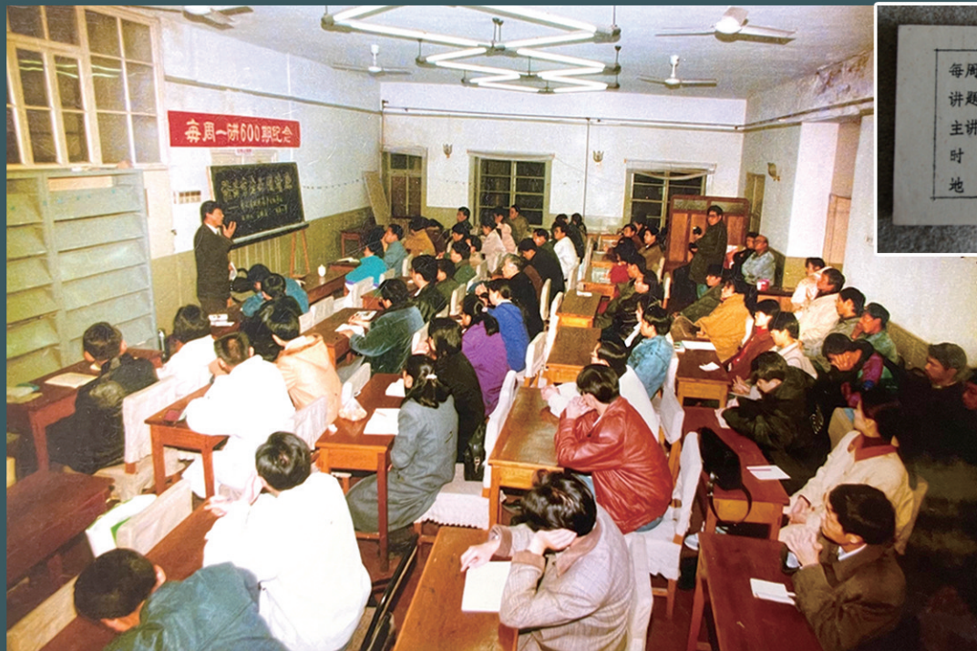
“每周一讲”第600期讲座,简陋的教室内坐满听众。