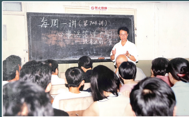
上世纪九十年代讲座照片。