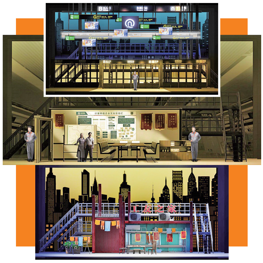
组图:《地铁六号线》舞美设计图。

导演黄港介绍,《地铁六号线》是一部反映现代地铁生活的话剧,它探讨了企业改革与民主管理的理念,深刻反映了青岛地铁集团“小立法+二次分配”政策的推广和实施,强调了班组建设的重要