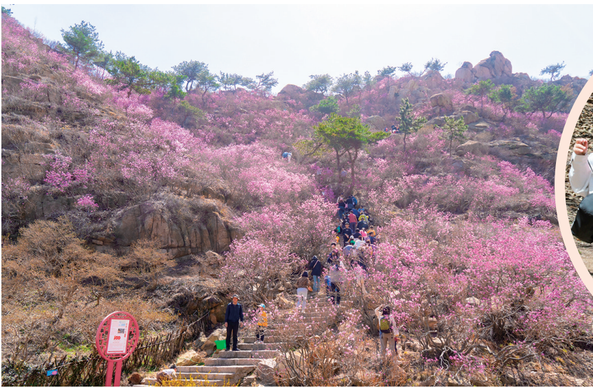
大珠山万亩野生杜鹃花迎来盛花期。

自即日起至4月6日举办的首届青岛西海岸青少年森林艺术画展,以“栗春——四月芳菲”为主题,通过展出150幅童趣满满的青少年绘画作品,将自然与艺术完美结合,点缀大珠山板栗森林