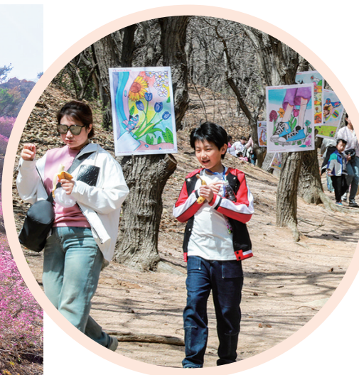
首届青岛西海岸青少年森林艺术画展。

此外,孩子们可以在“趣探索·秘境奇缘”乐园和板栗谷南区儿童游乐园尽情放飞自我,春来飞红石广场品种多样的美食也将满足每一位游客的味蕾。记者了解到,大珠山景区还将于4月4日至5日在石门寺举办宠物领养集市、手抄经体验等创意活动,以实际行动诠释人与自然和谐相处的美好愿景。