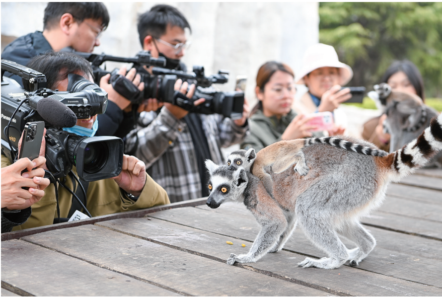
青岛森林野生动物世界的环尾狐猴妈妈和小狐猴。