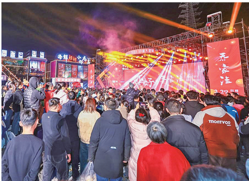
乔家洼商业街区开业庆典现场。

据悉,西海岸新区乔家洼商业街区位于古镇口大学城,3公里范围内覆盖哈尔滨工程大学创新发展基地青岛科技园、中国海洋大学西海岸校区、中国石油