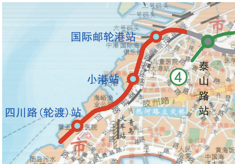
地铁2号线一期工程调整段线路示意图。