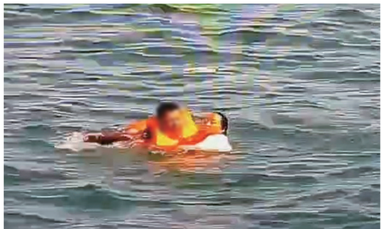
宁金龙海中托举落水者。视频截图