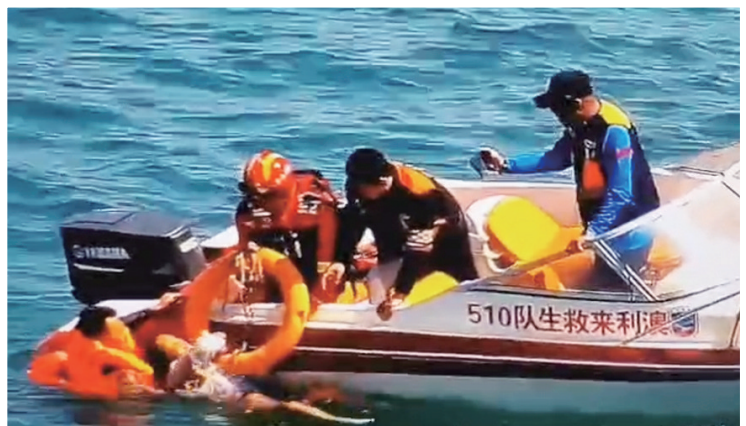
众人合力将落水女子抬上救援艇。视频截图