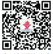
青岛早报微信公众平台

如果你在青岛生活、学习、工作中遇到难解决的烦心事,或者发现一些有意思的社会现象以及话题,都可以通过 青岛早报热线电话82888000 或在 青岛早报微信公众平台 留言联系我们,青岛早报“热线帮”当值记者将第一时间与你联系,做好沟通的桥梁,帮你一起想办法。