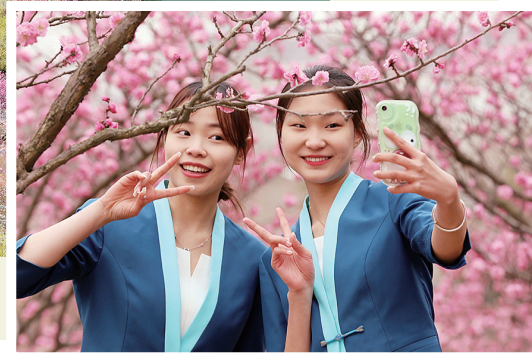
下图:市民在青岛梅园拍照。资料图片

运动康养类包括“梅景随行”登山节、“香约健康”健步行、“缤纷花海”百花节、“爱拼才会赢”电竞大赛、“春来话养生”等活动。其中“春来话养生”活动涵盖名医义诊、药膳展示、技术推广、八段锦表演等,让市民游客现场品药膳、喝茶饮,感受中医药文化的博大精深和独特魅力,切实满足居民群众多元化、多层次的健康服务需求。