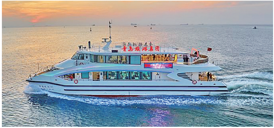
海上旅游可饱览青岛前海一线风光。

海风相伴,海浪相随,纵身亲海,以船为媒。自2022年以来,青岛旅游集团着力打造“海上观青岛”系列