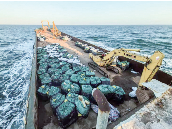
警方查获走私冻品。

2月16日晚,青岛市公安局海岸警察支队经过前期侦查,联合青岛海警局在董家口海域破获一起走私国家禁止进出口的货物、物品案。现场查扣走私母船1艘、过驳船舶1艘、吊车2台、作案货车2辆,抓获犯罪嫌疑人17名,查获走私冻品220余吨,涉案价值1800余万元,实现了从走私母船到陆上运输的全链条打击,切实铲除了青岛沿海走私犯罪滋生土壤,坚决遏制海上走私犯罪猖獗势头。经核实,此案查扣货物为该团伙首批走私货物,主要包括牛肚、牛蹄筋等冻品,均无合法来源手续及检验检疫证明,在公安机关和海警部门的及时打击下,避免了流入市场后可能造成的安全危害,有力维护了经济社会高质量发展。