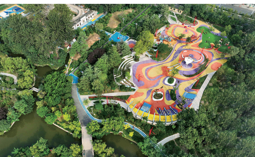
改造后的胶州公园。