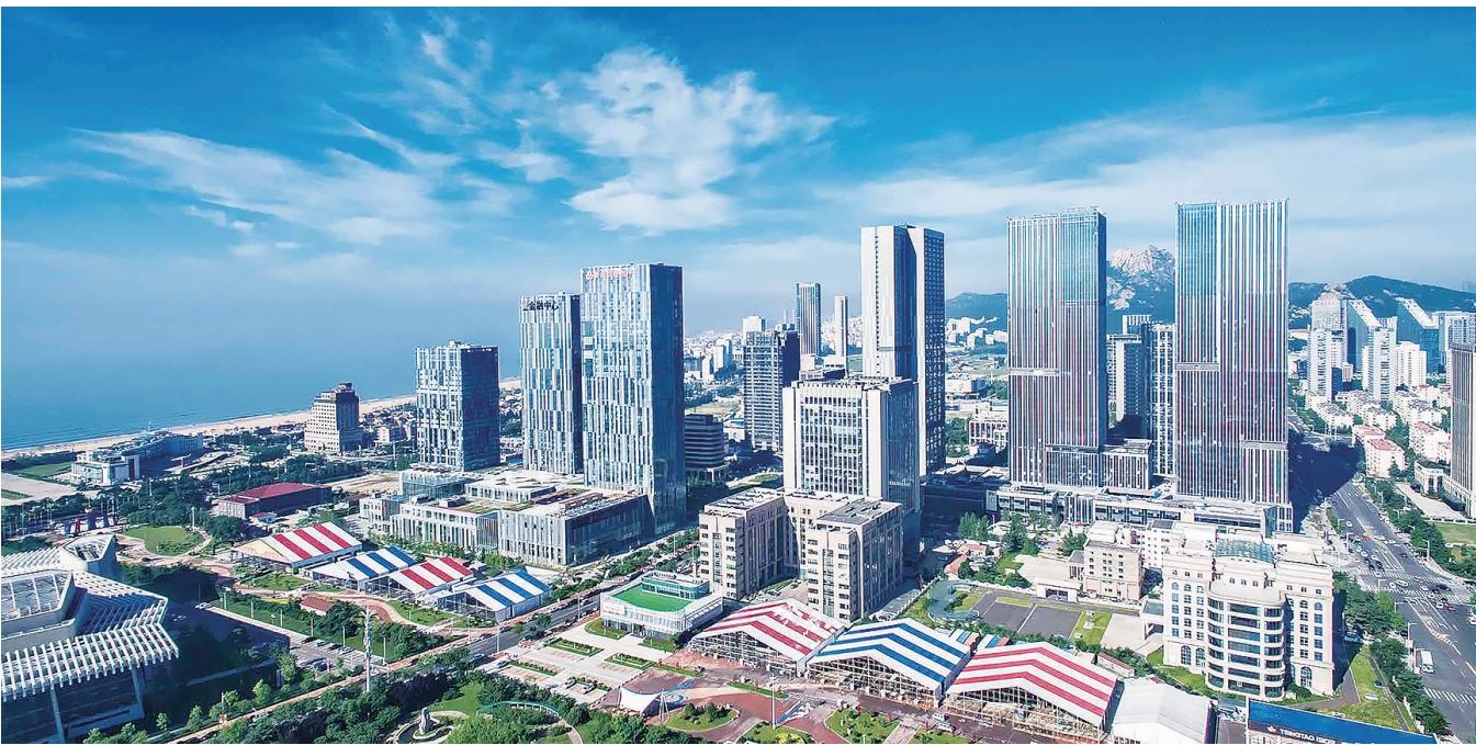
崂山金融谱写产业发展新篇章。

崂山区是全市实施创新驱动发展战略的重要阵地,科技的发展离不开金融活水的注入。作为青岛财富管理改革试验区的核心区,崂山区充分发挥金融资源配置作用,推动科技成果转化,逐步探索出一条推动科技创新与金融深度融合的创新打法。