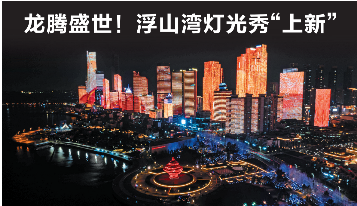
2月2日傍晚时分,以“龙腾盛世”为主题的浮山湾灯光秀亮相。