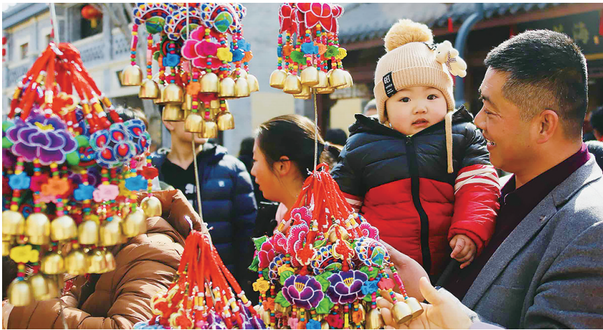
即墨古城新春庙会吸引市民前来体验。

祝福送给每一位漫步古城的游客。春节期间,有奖猜灯谜活动将在即墨古城戏台连廊上演,灯谜内容包罗万象,谜底涉及文字、成语、生活常识等。除了大家喜闻乐见的传统灯谜外,还特别增加了爱国主义题材的灯谜竞猜,展示中华优秀传统文化的独特魅力,弘扬爱国主义精神,为市民游客奉上一道精神文化大餐。