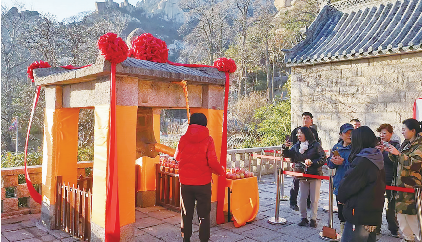
崂山太平晓钟祈福。

初七),在太清广场和太清宫内设置拍照打卡点、非遗文化市集、道乐演出等,并举办猜灯谜、软笔书写“吉祥”和历史人物互动答题抽奖等活动,为游客送福字、中国结及景区文创产品等。