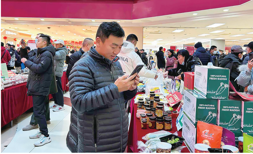
「荣军购物节」现场人气火爆。

公益项目区、年货大集区、臻旺市集区、荣军商品展销区……到处都是熙熙攘攘的人群,到处都是欢声笑语。在公益项目区,瀚海书画院、青岛琴岛书画院