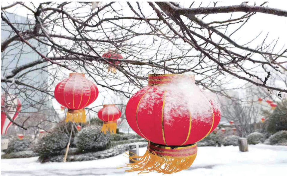
即墨龙泉公园雪景。