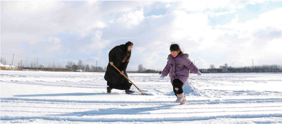
平度市蓼兰镇的村民在扫雪。