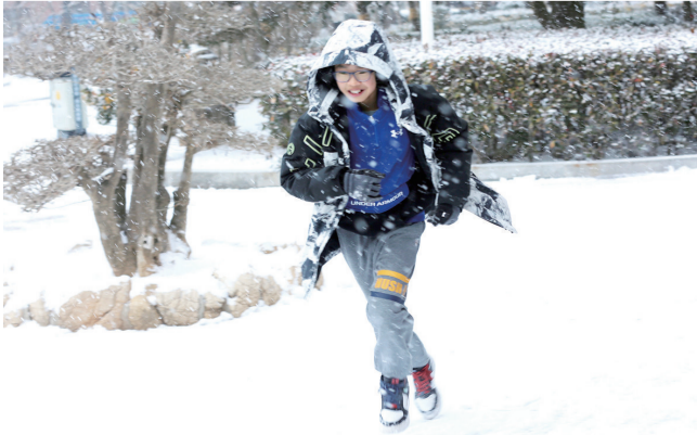
男孩在雪中撒欢奔跑。