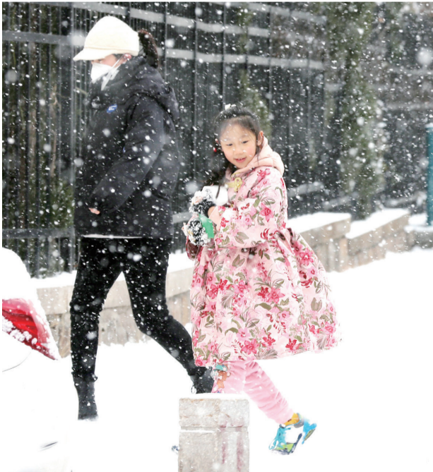
孩子望着片片雪花,满眼欢喜。