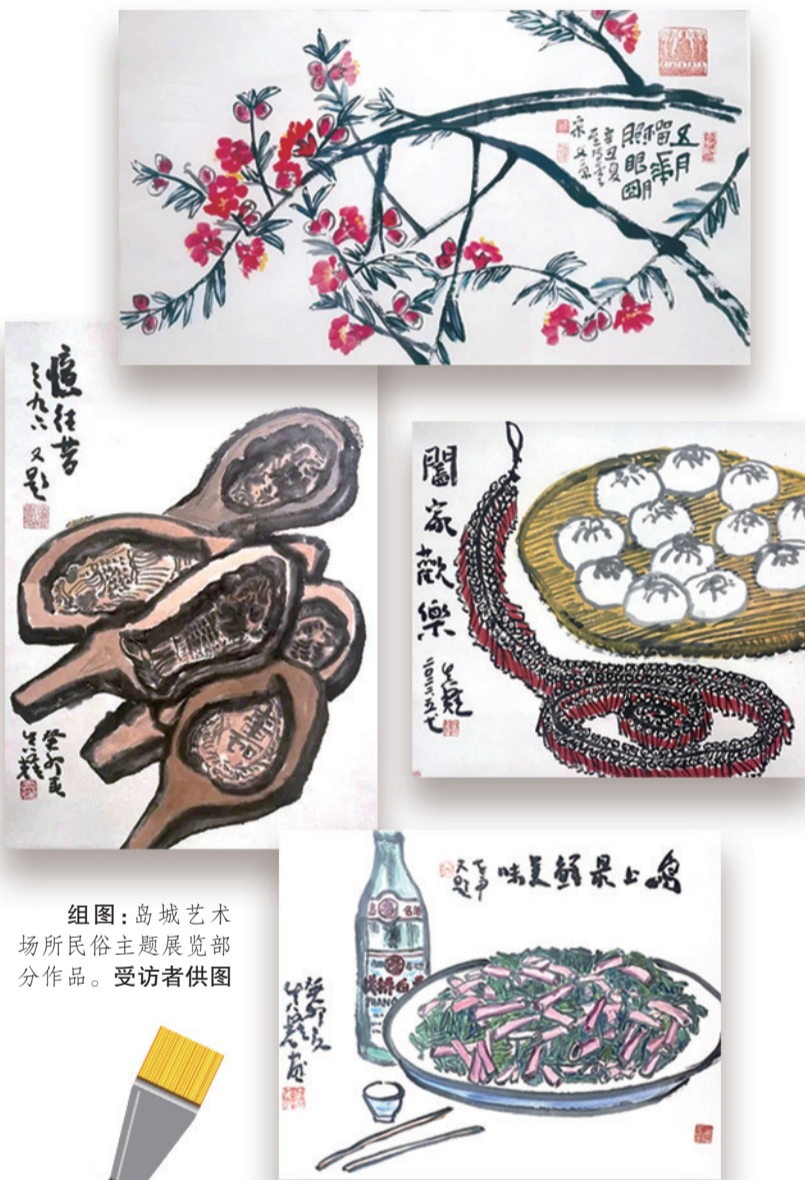
组图:岛城艺术场所民俗主题展览部分作品。