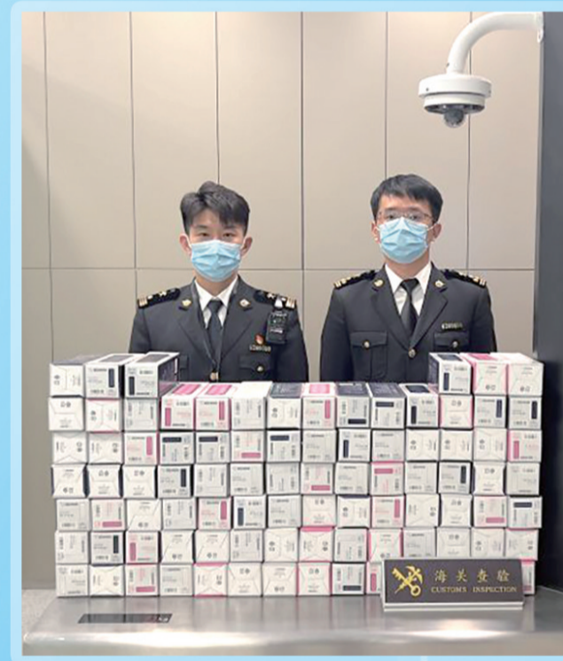
海关关员查获的超量保温杯。