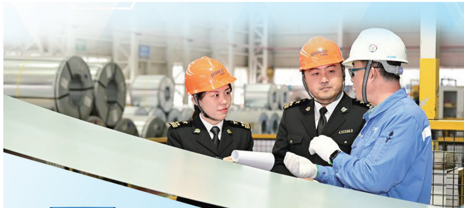
海关关员在辖区外贸企业调研国际市场开拓情况。

记者了解到,海关截获的异宠等外来物种多达近千种,包括4厘米长的蚂蚁、10厘米长的甲虫、30多厘米长的蜈蚣。这些被截获的“异宠”已依法依规进行了严格的安全处置。