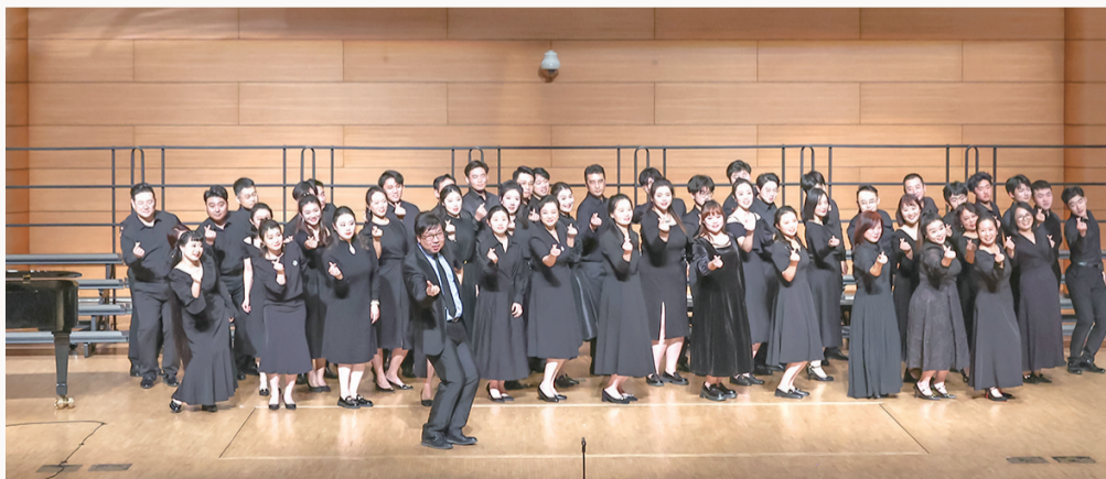
音乐会呈现了丰富多彩的表演形式。

早报1月8日讯 1月7日晚,睽违三载的青岛音协专场合唱音乐会在青岛大剧院音乐厅再度唱响,用美妙的和声传递出音乐的力量,并直抵人心。