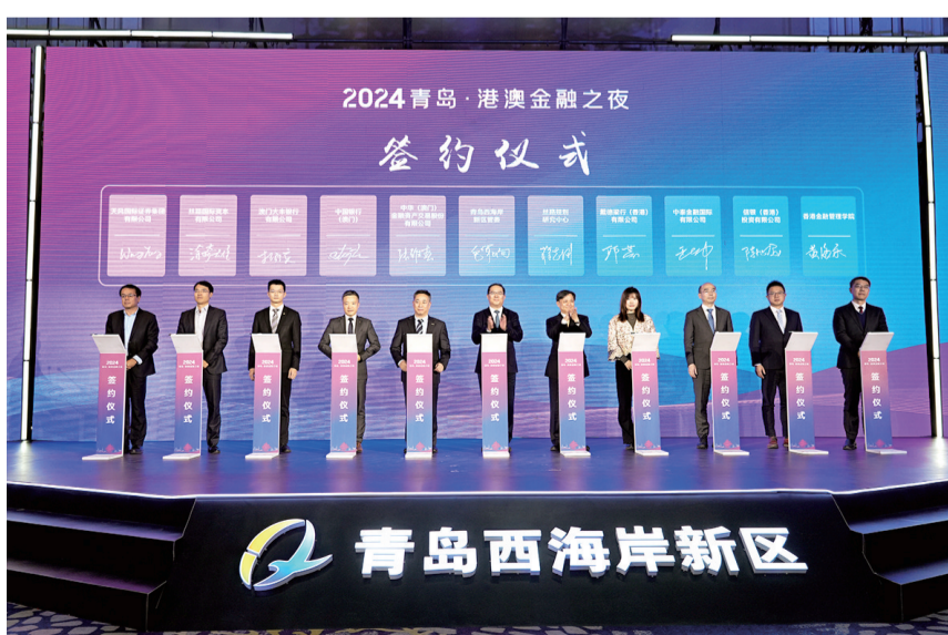
青岛西海岸新区管委与10家金融机构合作签约。