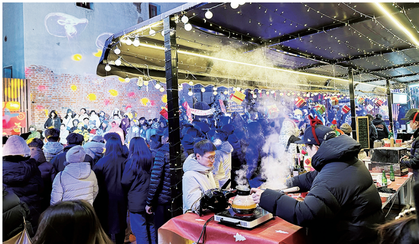
上街区包容了多样化的业态。

下力。老城复兴,创业先行,创新出台《市南区中山路创业空间管理办法》,在中山路片区分梯次打造“创业里院”“创业大街”“创业小巷”等特色创业场景,举办“lang咖啡生活节”“上街里啤酒节”等系列活动,导入新技术、新产业、新业态、新模式,吸引更多创新创业者加入。