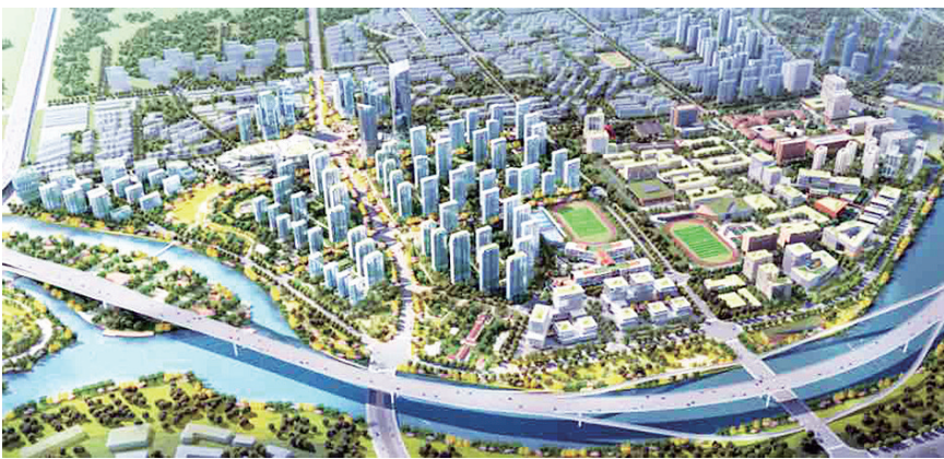
雁山科技生态城规划意向图。

生态城核心区,为青岛市轨道交通三线(地铁5、7、8号线)换乘枢纽站,同时为地铁沿线综合开发“21+N”重点项目之一,为贯彻落实市委市政府对青岛市雁山科技生态城高标准、高质量建设的要求,计划近期启动雁山科技生态城闫家山站TOD综合体SF1203-38-1地块地