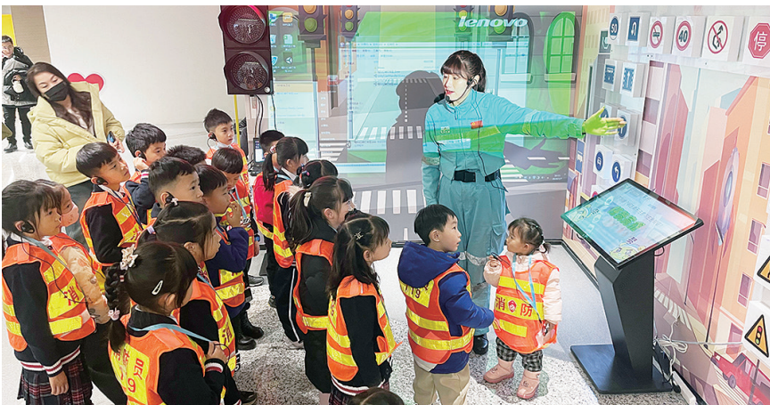
李沧区全生命周期安全体验馆开放。

沉浸式体验场馆,以安全科普为核心,以沉浸式互动体验为特色,利用实物或高科技设备,模拟各种灾害、事故场景,让参观者身临其境地进行学习,增强了安全学习的趣味性和主动性。