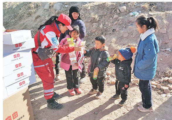
队员向震区儿童发放食物。