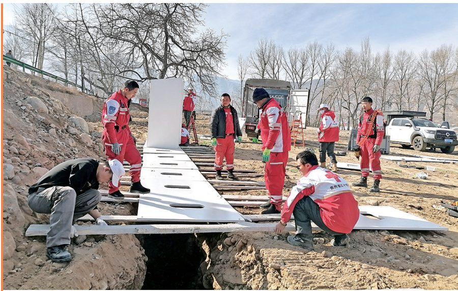
队员们给震区人民搭建临时活动区域。

2023年12月18日23时59分,甘肃临夏州积石山县发生6.2级地震。按照国家应急管理部和上级红十字会部署,青岛红十字搜救队一行18名队员于2023年12月19日21时40分出发,在12月21日凌晨2时29分抵达甘肃临夏州积石山县地震灾区,实施紧急救援。1月3日上午10时30分,18名队员圆满完成赈灾救援任务,平安凯旋,返回青岛市红十字搜救队港东训练基地。