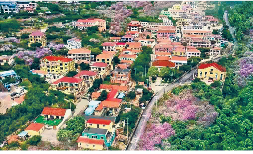
北宅街道南北岭村风景怡人。

南北岭村三面环山,空气清新,气候冷暖适宜,是崂山腹地一处充满生机和发展活力的宝地,曾获评“国家第二批森林乡村”“山东省森林村居”“山东省旅游特色村”“山东省景区化村庄”“青岛市文明社区”“青岛市安全社区”“青岛市五星