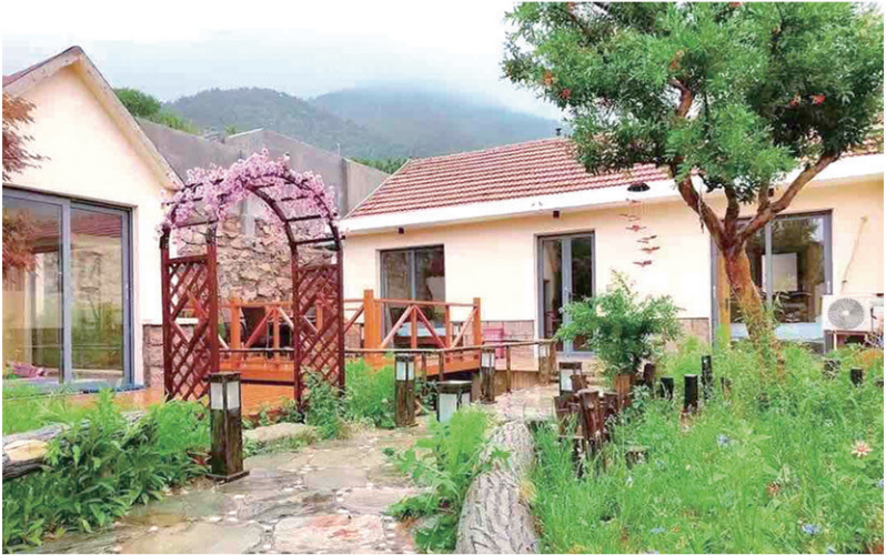
北宅人居环境不断提升。