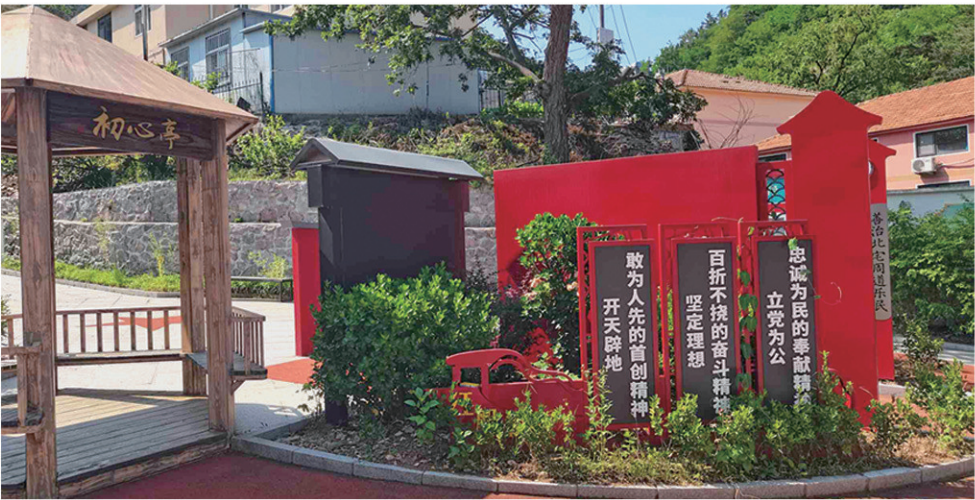
北宅基层社会治理“初心亭”。