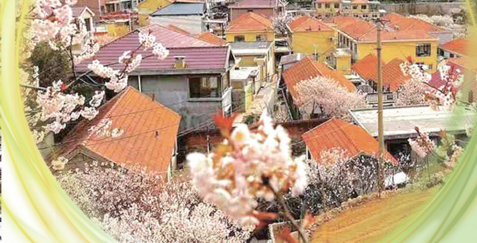
北宅街道春天樱花盛开。