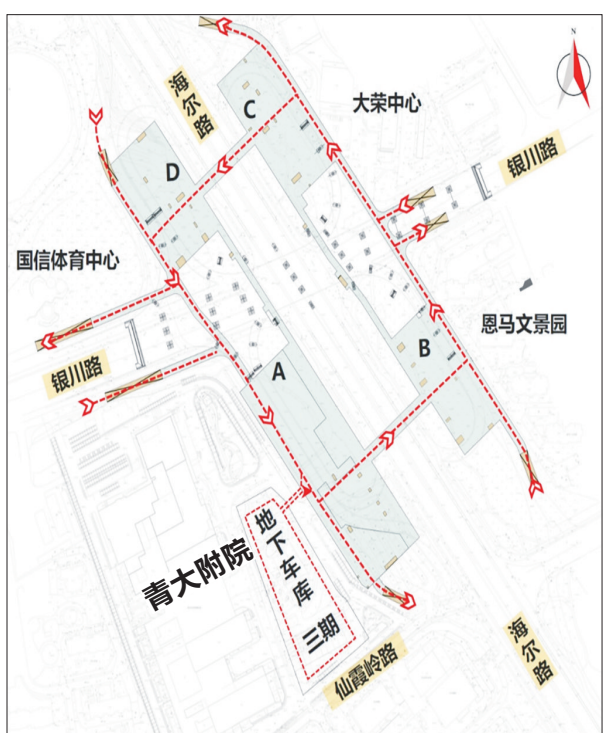
金家岭立交地下车库车行交通组织图。

国内首个集地上立交、地下公共停车、地铁换乘、商业服务于一体的金家岭立交桥地下综合交通中心今日正式投入运营。