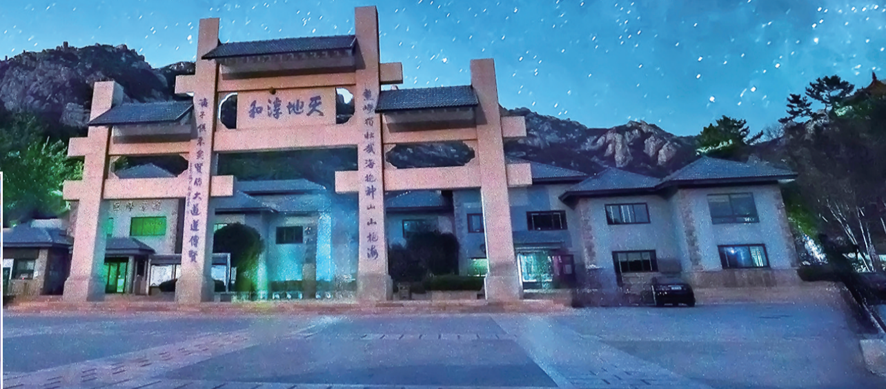
崂山是观星的好去处。