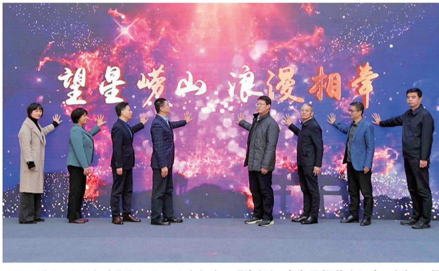
“望星崂山·浪漫相牵”崂山观星活动启动。

虽是仲冬,寒意渐浓,但是内心向暖。来到崂山,栖居瞰海民宿,既可仰望星空、放空身心,又可与亲朋好友围炉煮