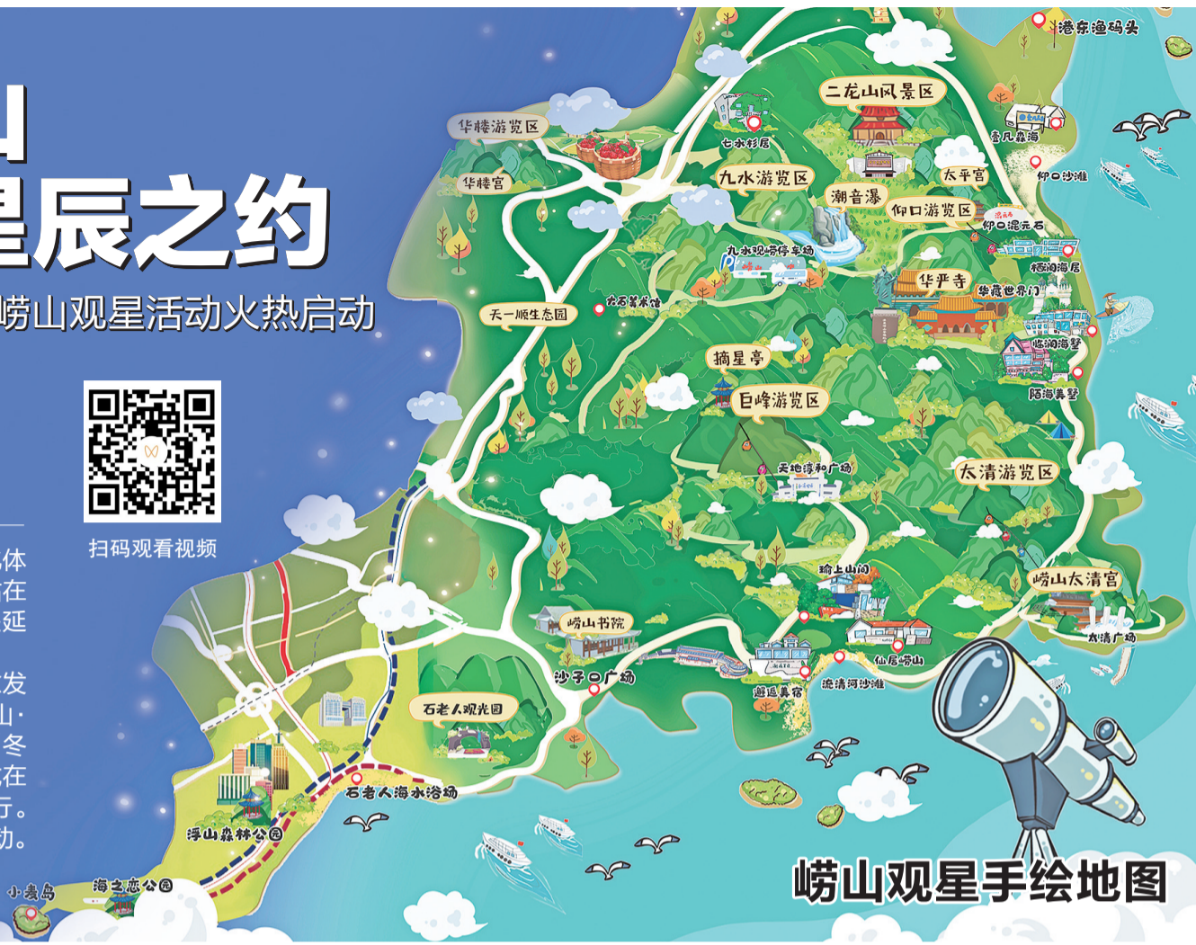
崂山观星手绘地图

斗转星移,崂山的浪漫气质愈发突出。12月19日上午,“望星崂山·浪漫相牵”崂山观星活动暨2023“冬趣崂山”文旅休闲季活动启动仪式在崂山(大河东)游客服务中心举行。这是崂山风景区首次举办观星活动。