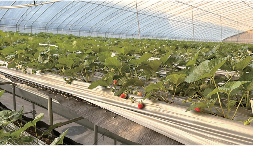
青岛东光明辉农业科技示范园。

数字农业园区,该项目以高效数字农业生产经营管理技术、现代农业温室大棚技术为重点,以增产增效并重、农机农艺结合、生产生态协调为基本要求,促进农业技术集成化、劳动过程机械化、生产经营信息化,构建适应高产、优质、高效、生态、安全农业发展要求的技术体系,形成了一整套现代科技农业的经营管理体系。