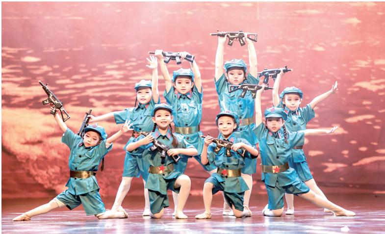
儿童芭蕾舞剧《红色娘子军》演出现场。

弟子们:“写字者,写志也。”鲁奖得主、评论家贺绍俊认为:“甘草的甘平之味完全渗入阿占的《墨池记》里,她用一种温和平缓的叙述来表达自己的至善的书法情怀。”鲁奖得主、评论家王干认为:“《墨池记》全篇写的是学书法,讲的却是情感。书法的传承,既是书法技艺上的,更是精神情怀上的,潺潺流在笔墨之间,疏通了人的经络,直让五脏六腑充溢着暖流。”《小说月报》执行主编、编辑家徐福伟认为:“传统文化无声地涵养着当代作家的创作,甚至从某种意义上而言决定了当代作家的写作高度与深度。阿占的《墨池记》借书法演绎人事兴衰,以传承传统文化为己任,向传统文化致敬。”